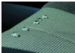
Nano effect on car seat

Dankzij de MaxxLube Nano coating producten kunt u uw kostbare bezittingen langdurig beschermen. Of het nu gaat om de lak van uw auto, uw autobekleding, velgen e.d., MaxxLube heeft het juiste product hiervoor. De mogelijkheden zijn onbegrensd. Door de langdurige hechting van de MaxxLube Nanocoatings beschermt u niet alleen uw kostbaarheden, u zult ook merken dat u veel geld bespaart op de kosten in de wasstraat en voor poets- en reinigingsmiddelen. Een MaxxLube Nanocoating is een investering die niet alleen uw portemonnee spaart maar ook het milieu.